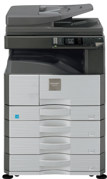
Pokazano model AR-6023N

AR-6023D/N AR-6020D/N AR-6020 Monochromatyczne urządzenie wielofunkcyjne