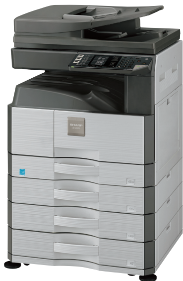
Pokazano model AR-6023N

Jeśli zależy Ci na pracy w sieci, wybierz model AR-6020N pracujący z prędkością 20 stron na minutę lub model AR-6023N pracujący z prędkością 23 stron na minutę. Jeśli potrzebujesz lokalnego urządzenia wielofunkcyjnego (druk poprzez USB), możesz ograniczyć wydatki, wybierając jeden z trzech modeli AR-6020D, AR-6020 i AR-6023D.